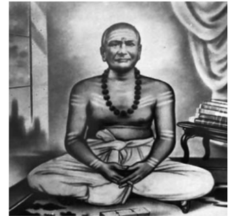
மகாவித்துவான் மீனாட்சிசுந்தரனார் (1815 - 1876)